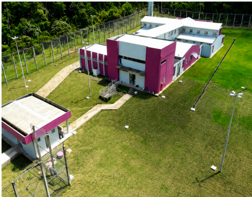
FIGURA 7: Vista panorâmica do centro de recuperação feminina de Santarém.