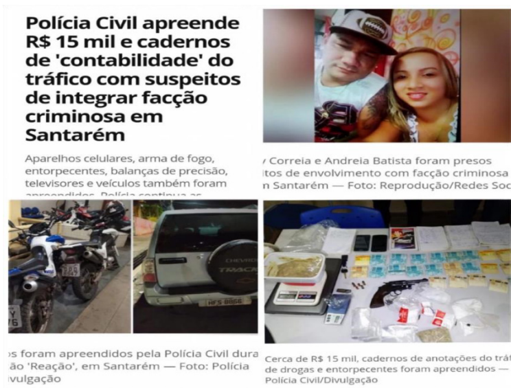
FIGURA 3: Estouro de boca de fumo comandada por mulher.