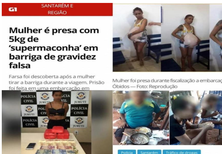
FIGURA 2: Falsa grávida

As mulheres fazem uso de utensílios que predominam o universo feminino com o intuito de não serem reconhecidas e passarem despercebidas durante uma abordagem policial. Um dos disfarces que chamou atenção recentemente, conforme reportagem do G1, foi a barriga falsa para esconder vários pacotes embalados de substância entorpecente. Contudo, levantou-se suspeita devido a mulher estar grávida na embarcação e instantes depois, não apresentar mais características de gestante. Como se constata na figura a seguir: